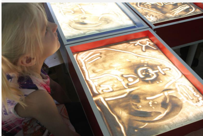
Занятие в песочной студии. Подготовительная группа.