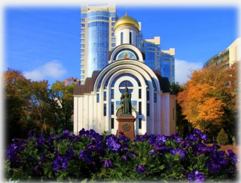
Старо-Покровский храм. г. Ростов-на-Дону, ул. Большая Садовая, 113Б