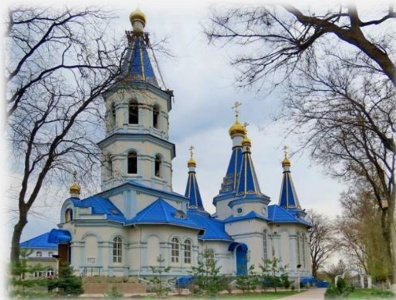
Храм Покрова Пресвятой Богородицы. г. Ростов-на-Дону, ул. Орбитальная, 1Б