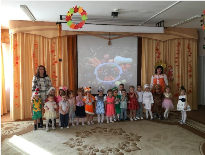
Праздник осени в младшей группе «Звездочки»