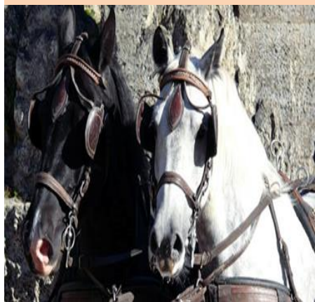
Шоры (наглазники, щитки)