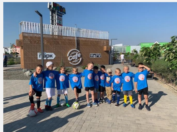
Наша команда футболистов.