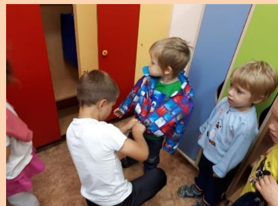
Дети из подготовительной группы помогают самым маленьким воспитанникам одеться на прогулку.