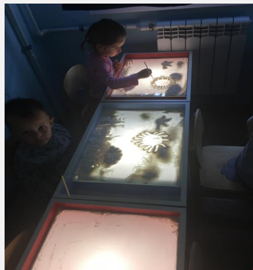
Занятие в песочной студии. Средняя группа.

В октябре одно из занятий в песочной студии было посвящено празднику Покров. Дети из старшей и подготовительной групп рисовали иллюстрацию к стихотворению о празднике Покров. А младшие группы изображали осенние солнечные дни, перелетных птиц и клумбу с осенними цветами.