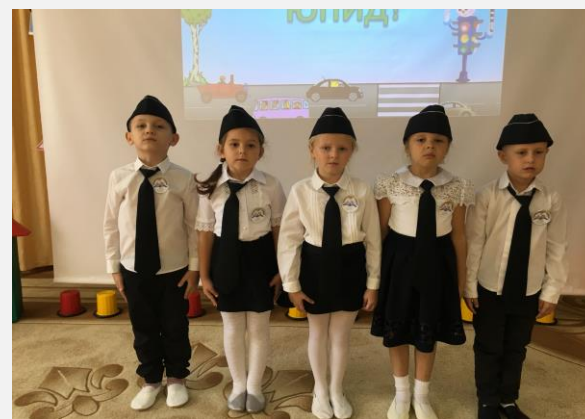
Команда ЮПИД «Дорожный патруль».