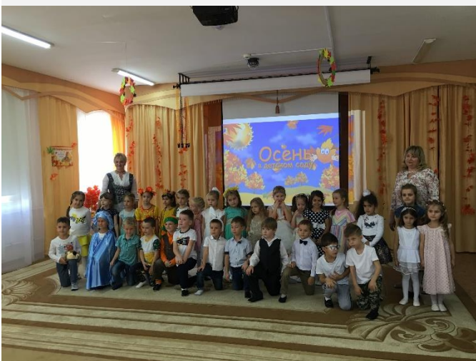
Праздник осени в старшей группе.

16 и 17 октября в МБДОУ №19 «Аленушка» прошел осенний праздник. Праздник удался на славу, он принес всем его участникам радостное настроение и яркие эмоции.